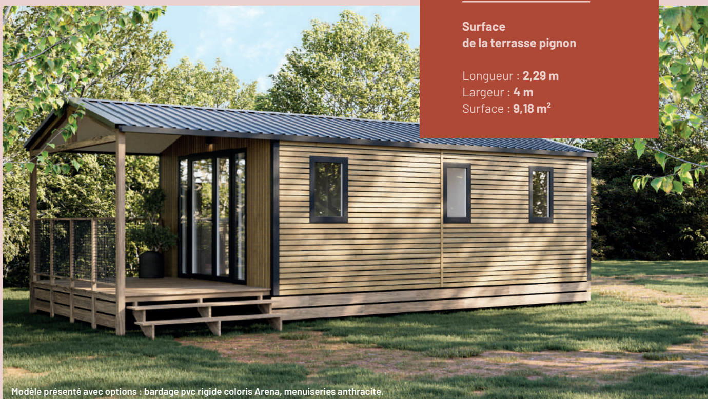
Modèle présenté avec options : bardage pvc rigide coloris Arena, menuiseries anthracite.

Longueur : 2,29 m Largeur : 4 m Surface : 9,18 m 2