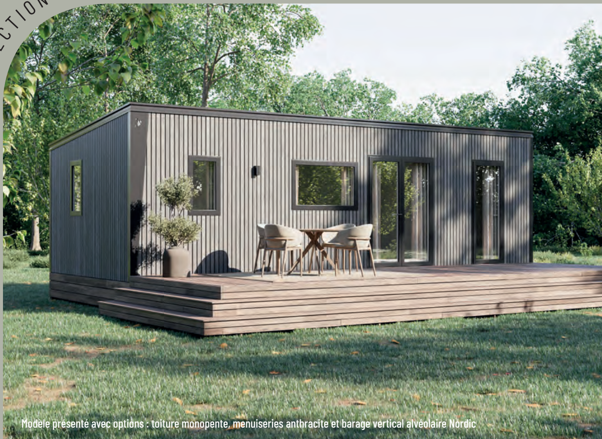
Modèle présenté avec options : toiture monopente, menuiseries anthracite et barage vertical alvéolaire Nordic