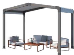
Espace de détente