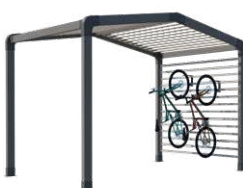
Range-vélos et/ou stockage

Sas d'entrée, espace détente ou de stockage, chambre indépendante, les modul'homes s'adaptent aussi bien aux mobil-homes 1 pente que 2 pentes. Ils peuvent se positionner en pignon, comme un sas ou détaché du mobil-home.