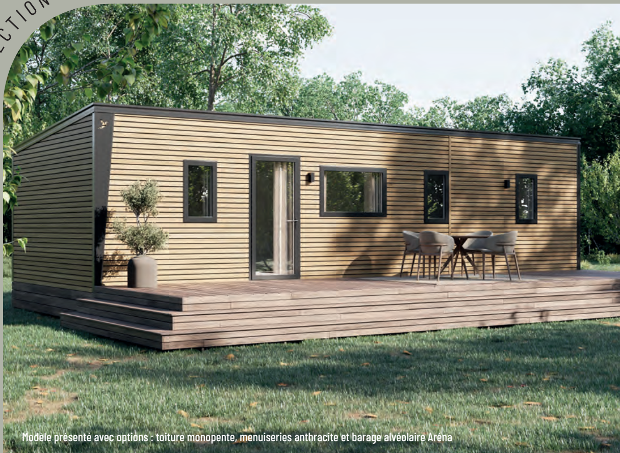
Modèle présenté avec options : toiture monopente, menuiseries anthracite et barage alvéolaire Aréna